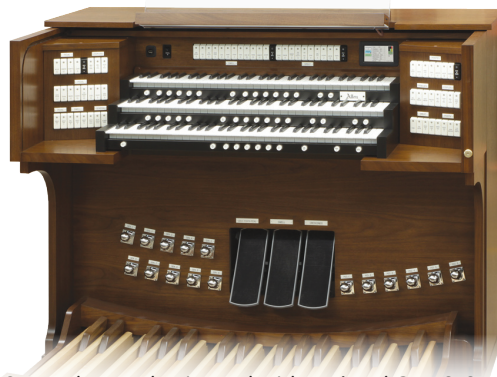
Stop Tab console pictured with optional GENISYS Voices and 32-Note Parallel Pedalboard.

Innowacyjne wytwarzanie zapewnia nieporównywalne opcje personalizacji i wsparcia produktu. Allen produkuje układy elektroniczne, kontuary, registry oraz zespoły we własnym zakresie. To, wraz z poświęceniem na rzecz jakości oraz zapewnieniem części zamiennych dla starszych modeli, przekłada się na instrumenty, które wystarczają na dłużej i są tańsze w utrzymaniu na dłuższą metę.